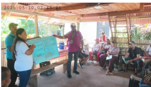
Ilustración 2: Proceso formación de la ficha 3485659 Herramientas para el fomento de la asociatividad rural desarrollada en la vereda San pablo zona rural del Distrito de Riohacha

Nota: Evidencia del proceso de formación del Programa “emprendimiento de unidades productivas desarrollada en la vereda San pablo zona rural del Distrito de Riohacha